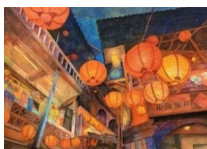
デザイン部門 優秀賞 2年 三宅成喜 「紅提灯」