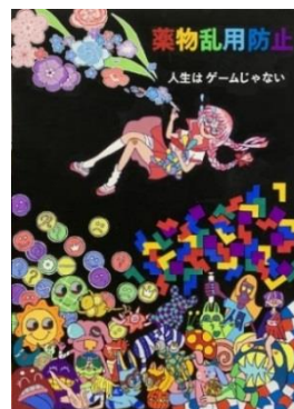
デザイン部門 優秀賞 2年 山村夕結 「人生はゲームじゃない」