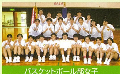
バスケットボール部女子