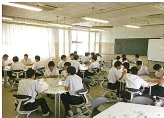
Active Learning Power Studio (ALPS)