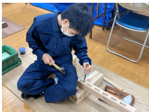
3級技能検定（建築大工）

機械系、電気系、建築系の専門科目を学ぶことができ、将来の職業選択の可能性が広がります。各種技能競技大会や、様々な資格試験に挑戦できます。