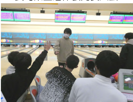
送別ボウリング大会