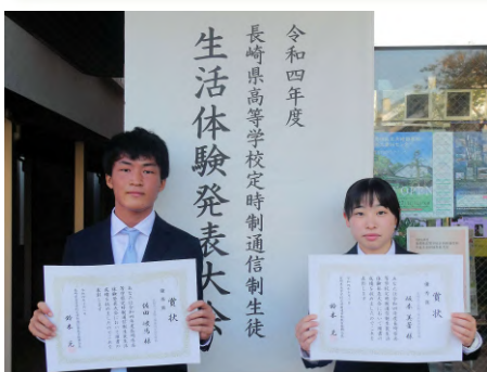
長崎県生活体験発表大会

生徒交流会、校内生活体験発表会、校内競技大会、体育祭、文化鑑賞会、修学旅行、送別ボウリング大会など、楽しい学校行事で交流が深まります。