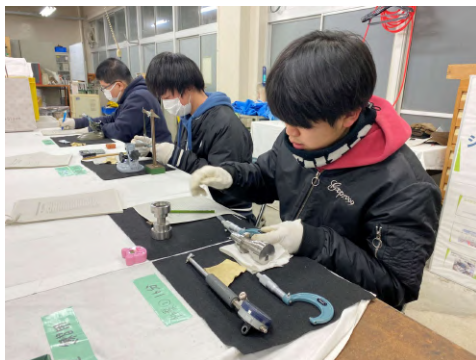
3級技能検定（機械検査）