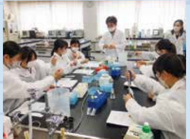
理系課題研究の様子