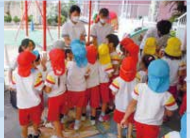
文系課題研究の様子