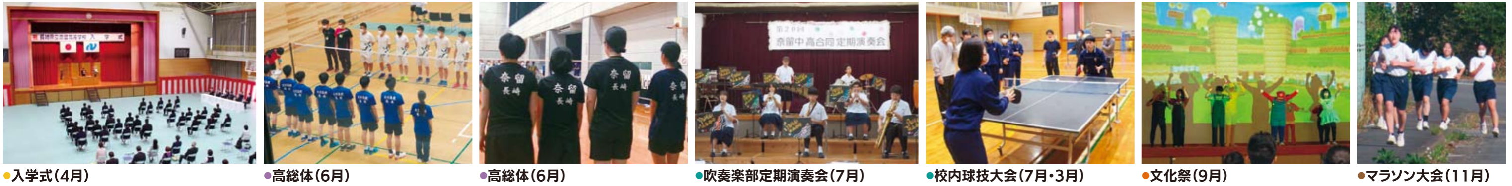
●入学式(4月) ●高総体(6月) ●高総体(6月) ●吹奏楽部定期演奏会(7月) ●校内球技大会(7月・3月) ●文化祭(9月) ●マラソン大会(11月)