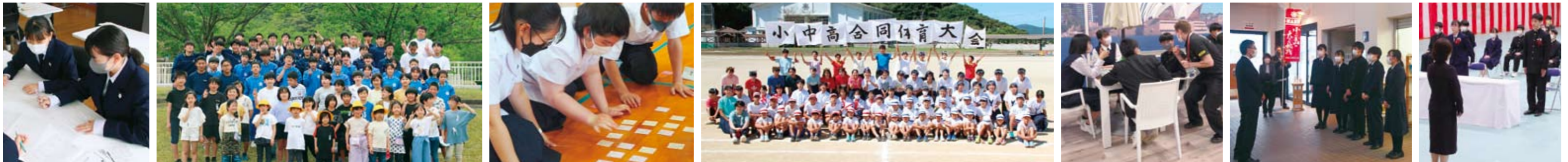
●新入生研修会(4月) ●小中高合同歓迎遠足(4月) ●小中高合同かるた・百人一首大会(6月) ●小中高公民館合同体育大会(9月) ●海外語学研修修学旅行(12月) ●大学入学共通テスト(1月) ●卒業式(3月)