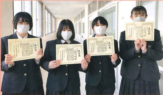
家庭科技術検定三冠王