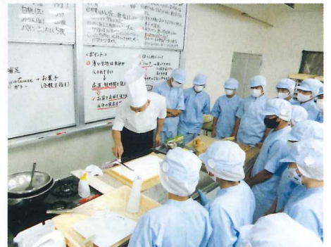
産業エキスパートセミナー(洋菓子)