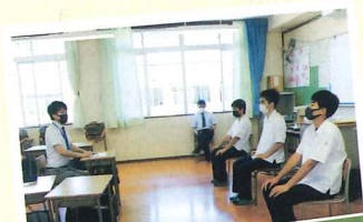
3年生進路ガイダンス