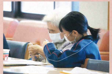
高齢者福祉施設実習