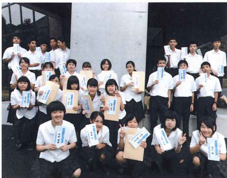
食品衛生責任者講習