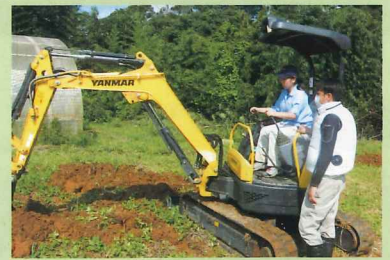
小型建設機械研修