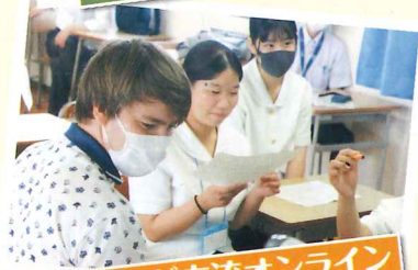
オランダ交流オンライン