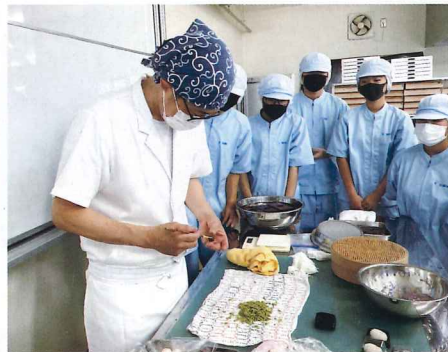
産業エキスパートセミナー(和菓子)