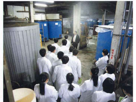
潜龍酒造見学(発酵の学習)