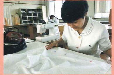
シャツブラウス製作