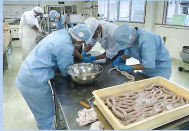
ソーセージの製造