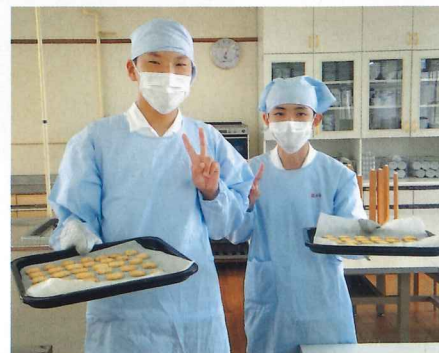
高総体応援クッキー作り