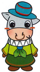
マスコットキャラクター「ホクノン」