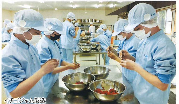
イチゴジャム製造