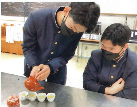
お茶の入れ方教室