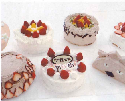
調理実習 クリスマスケーキ