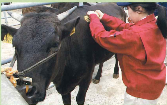
牛のブラッシング

和牛を中心とした大動物、または中小家畜（鶏）やペット動物の飼育管理の知識、技術について学びます。