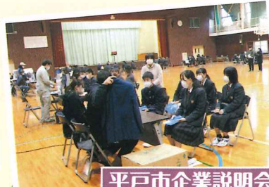
平戸市企業説明会