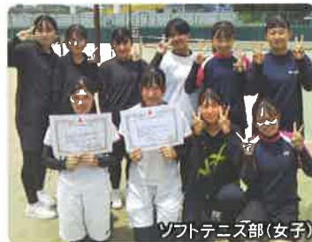
ソフトテニス部(女子)