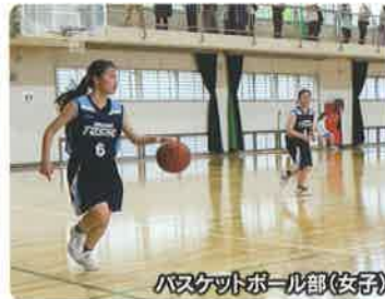
バスケットボール部(女子)