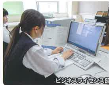
ビジネスライセプス部