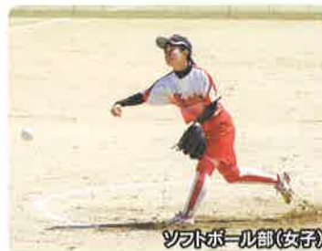
ソフトボール部(女子)