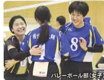
バレーボール部(女子)