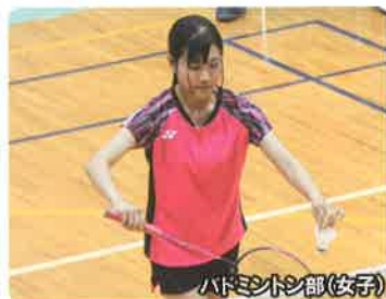
バドミントン部(女子)