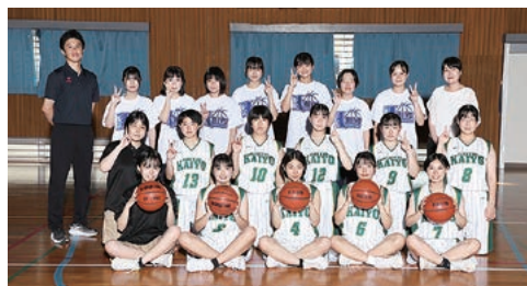
バスケットボール (女)