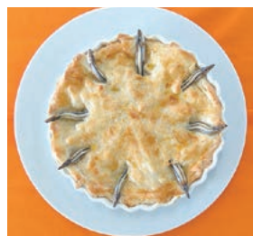
総合文化 (写真・美術・書道・家庭)