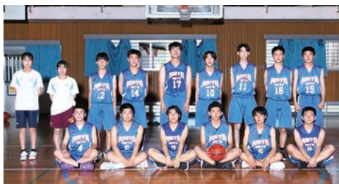
バスケットボール (男)