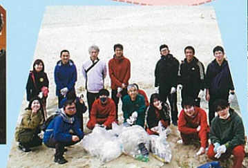
ボランティア清掃