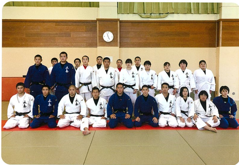
柔道部の主な実績(R3~R4年度)