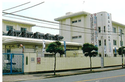
■学生寮 五島市池田町3-5(五島高校から徒歩5分)