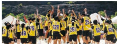
ことのうみ祭(体育の部)