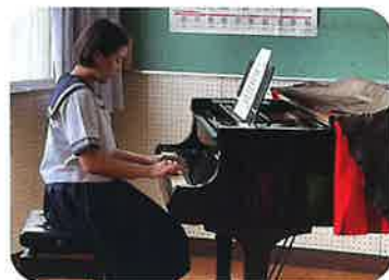
保育検定 音楽リズム