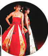
文化祭 (ファッションショー)