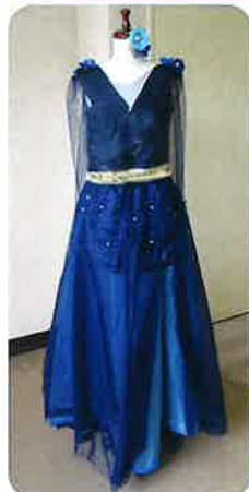
2022クリエイティブ コンテスト 東京展示作品