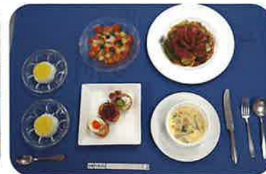
1級食物調理検定作品「調理」 (フルコース料理)