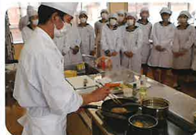
エキスパートセミナー (西洋料理)