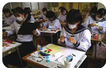
保育検定 造形1級作品