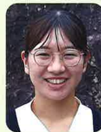
【令和4年度 卒業生】 島原市役所