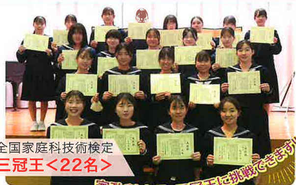
全国家庭科技術検定 三冠王<22名>