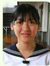
【令和5年度 在校生】 情報処理科1年生(島原第一中出身)

私は3年間島原商業高校で過ごした時間はその後の生き方に影響を与えたと思います。情報処理科では、簿記・情報処理関係の資格を取得することができ、その後の進路先で活用することができました。また、高度資格にチャレンジすることができ、自分自身成長することができます。ExcelやWord、Accessに特化した勉強ができ、パソコンやソフトウェアに強くなります。また、全生寮での挨拶や集団行動を通して、島原商業高校でこれから過ごす基盤や人としての在り方を学ぶことができるので、自身にとっても貴重な経験になりました。学校行事を通して仲間とコミュニケーションをとりながら、切磋琢磨して過ごすことができたので、とても有意義な時間になりました。皆さんも島原商業高校で多くのことを学び、仲間や先生方と一緒に充実した生活を送ってみませんか。