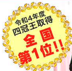
全国家庭科技術検定 四冠王<12名>