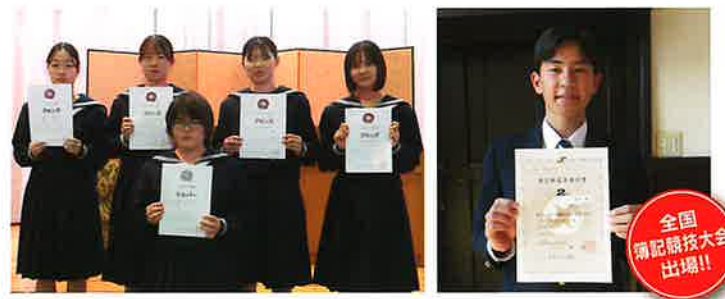
ビジネスマイスター受賞者 (令和4年3月卒業生)