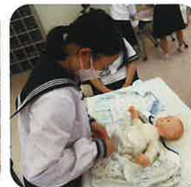
保育検定 家庭看護