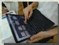
EdTech サービスを活用した授業

国語表現、基礎数学、書道Ⅰ、工芸Ⅰ（陶芸）、琴Ⅰ、総合英語Ⅰ、韓国語、中国語、文学国語、サイエンス・ラボ、美術Ⅰ、器楽Ⅰ、スポーツⅠ、ディベートディスカッションⅠ