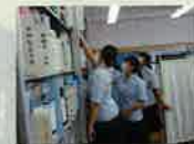
充実の進路資料室 全国の学校・企業の最新情報がわかる

オンリーワンの人生を輝かせるために、翔南で充実した高校生活を過ごしてみませんか？