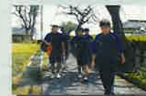
ふるさとウォーク