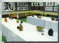
書道・工芸授業選択者作品

文学国語、情報処理、ファッション造形基礎、音楽、素描、エッセイライティングⅠ、国語表現、音楽Ⅱ、食文化、ビジュアルデザイン、スポーツ総合演習 美術Ⅱ、書道Ⅱ、工芸Ⅰ（陶芸）、フードデザイン、器楽Ⅱ、琴Ⅱ、韓国語、中国語