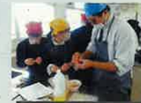
地元の素材を使ったスイーツ開発

また、学校行事でも地域清掃やふるさとウォークなどを実施し、ふるさと南島原についての理解を深めています。