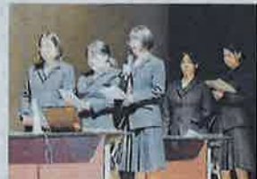
地域を探究した結果を発表する川棚高の生徒(川棚町公会堂)

1年の2グループは「アラカわたな」と銘打ち、町内を歩いて感じた疑問を調べた。下組郷の奥指定史跡「川棚町