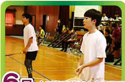
6月 全国定通体育大会県予選

定時制・通信制の体育大会で、全国大会につながる県予選です。11月には、中地区3校(大村・諫早・島原)の体育大会も実施されます。