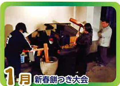
1月 新春餅つき大会

この一年の健康と幸福を祈ると同時に、新成人のお祝いも兼ねて行います。また、つきあげた餅で島原名物の具雑煮を作り全員でいただきます。