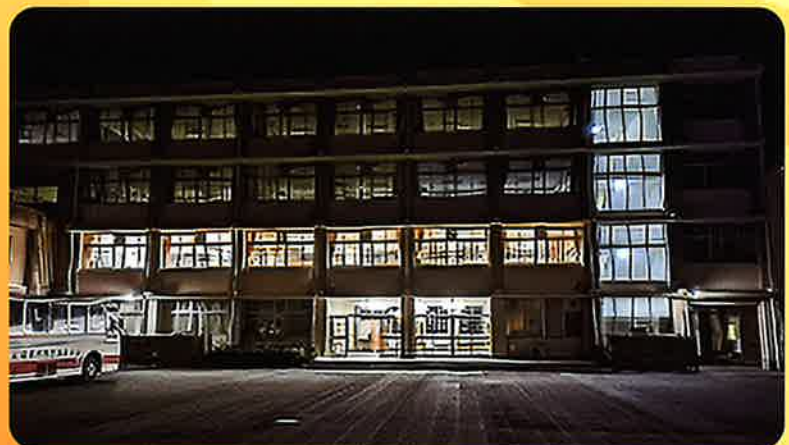
【灯りがとまった定時制の各教室】