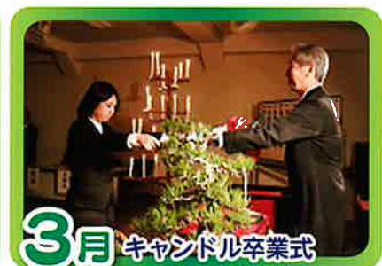
3月 キャンドル卒業式