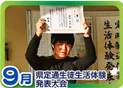
9月 県定通生徒生活体験発表大会

限られた日課のなかでも、ふれあいと融和を大切にしながら、生徒会を中心に創意ある学校行事を目指します。