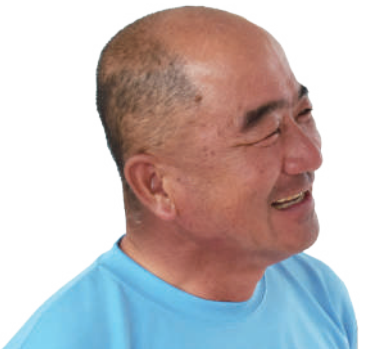
生徒・地域・家庭