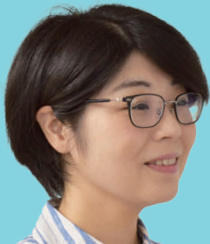
過去・現在・そして未来へ