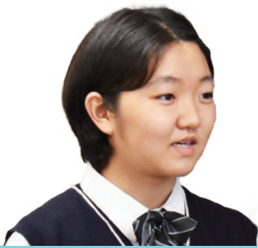
島原翔南に出会って