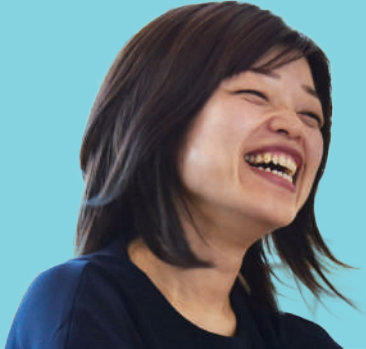
先生と生徒の距離感