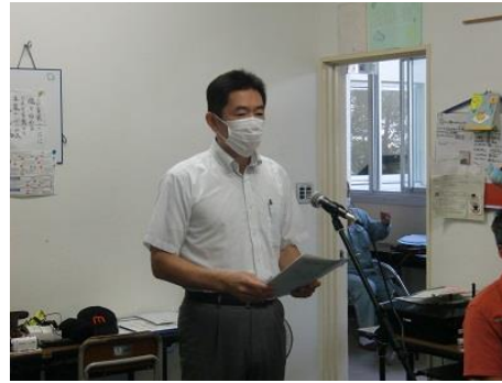
激励の言葉は放送室から