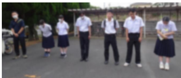
7月5日(金)校門での様子