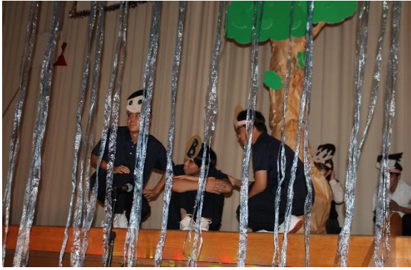
文化祭テーマ「共助」を生徒会が